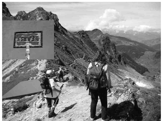
Ein Blick auf das Gargellener Joch und ein Blick in die Schweiz.