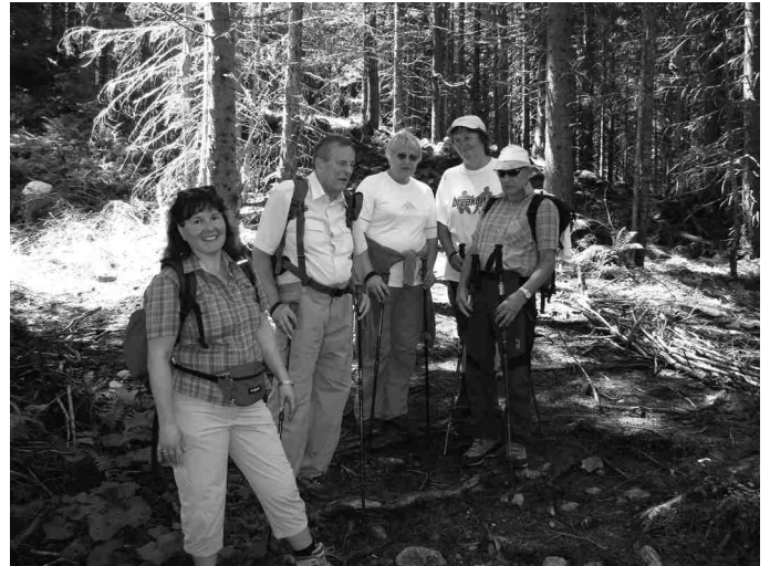
Wir wanderten ein wenig um Kondition zu tanken für die große Tour auf das Gargellener Joch.