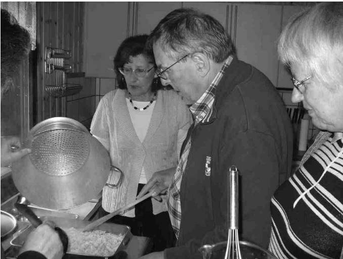
Was wird es heute geben? Die Häfelergucker am Werk!

Mit diesem etwas längeren Bericht wollen wir vielen Menschen, ob jung oder alt, die Wanderwoche für 2011 schmackhaft machen.